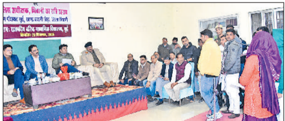
भिवानी। रात्रि ठहराव के दौरान लोगों की शिकायतें सुनें हुए।

अधिकारियों को निर्देश दिए कि वे 15 दिन के अंदर-अंदर ग्रामीणों द्वारा दी गई समस्याओं पर अपनी कार्रवाई की रिपोर्ट प्रस्तुत करें। ग्रामीणों की समस्याओं को गंभीरता से न लेने वाले अधिकारियों के खिलाफ विभागीय कार्रवाई अमल