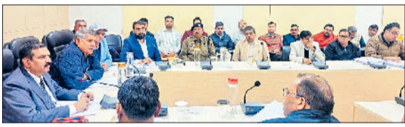
चरखी दादरी। जिला विकास समन्वय एवं निगरानी समिति की बैठक लेते सांसद।

उन्होंने कहा कि पिछले अनुभव के आधार पर देखा गया है कि बरसात की मात्रा में बढ़ोतरी हो रही है और नए नए क्षेत्रों में जलभराव की समस्या सामने आ रही है। साथ ही यह भी देखने में आया है कि नए बनने वाले मार्गों के साथ पानी निकासी की व्यवस्था नहीं हाती है, जिसके कारण यदि एक तरफ पानी भर जाता है तो उसे निकालना बहुत मुश्किल हो जाता है। ऐसे में सड़क मार्ग बनाने वाली सभी एजेंसियों सुनिश्चित करें कि किसी भी प्रस्तावित या नए बनने वाला नेशनल हाइवे या स्टेट हाइवे के साथ आबादी क्षेत्र में सर्विस रोड जरूर हो और इसके अलावा हाइवे के दोनों ओर पानी निकासी की व्यवस्था भी हो। बिना इन प्रावधानों के रोड के डिजाइन ना बनाए जाएं।