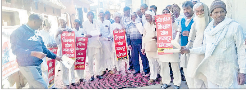
तोशाम। अदालत के फैसले का विरोध जताते हुए।

उनका कहना था कि हम जानते हैं कि विशेषज्ञ सर्वोच्च न्यायालय के उक्त फैसले को लेकर बेहद चिंतित हैं। उनका मत है : पहला, यह 100 मीटर की ऊंचाई पर आधारित अरावली