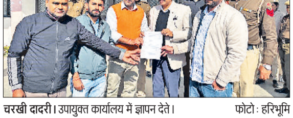
चरखी दादरी। उपायुक्त कार्यालय में ज्ञापन देते।