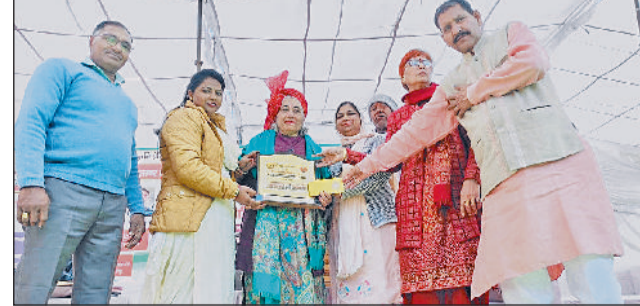
भिवानी। मुख्यअतिथि को सम्मानित करके सांग का शुभारंभ कराते हुए।

भारतीय लोक परंपराओं को जीवंत करने और युवा पीढ़ी को अपनी जड़ों से जोड़ने के उद्देश्य से जिला के गांव उमरावत में जारी पांच दिवसीय सांस्कृतिक महोत्सव का बुधवार को दूसरा दिन ऐतिहासिक रहा। म्हारी संस्कृति म्हारा स्वाभिमान संगठन के तत्वावधान में सूर्य कवि पंडित लखीचंद सांस्कृतिक भवन उमरावत में आयोजित इस भव्य कार्यक्रम में बुधवार को लोक कला और साहित्य को त्रिवेणी देखने को मिली। कार्यक्रम