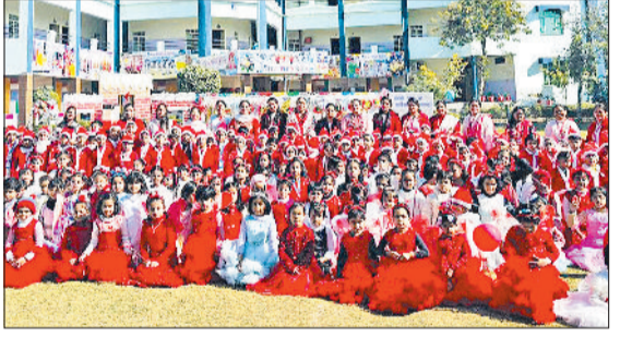
नारनौल। क्रिसमस डे कार्यक्रम के दौरान बच्चे।