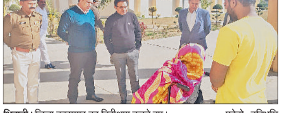
भिवानी। जिला कारागार का निरीक्षण करते हुए।